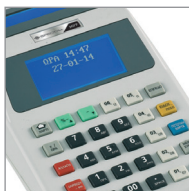
SPECTRA 107 ΛΕΥΚΗ