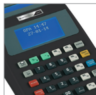
SPECTRA 107 ΜΑΥΡΗ